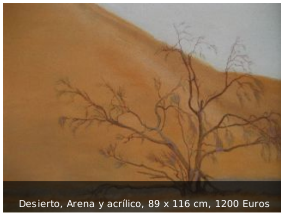
Desierto, Arena y acrílico, 89 x 116 cm, 1200 Euros

Este verano expuse en Francia: en el Domaine de Cinquau: una antigua Bodega situada cerca de Pau y después en el Ayuntamiento de Tarbes junto con otros dos pintores.